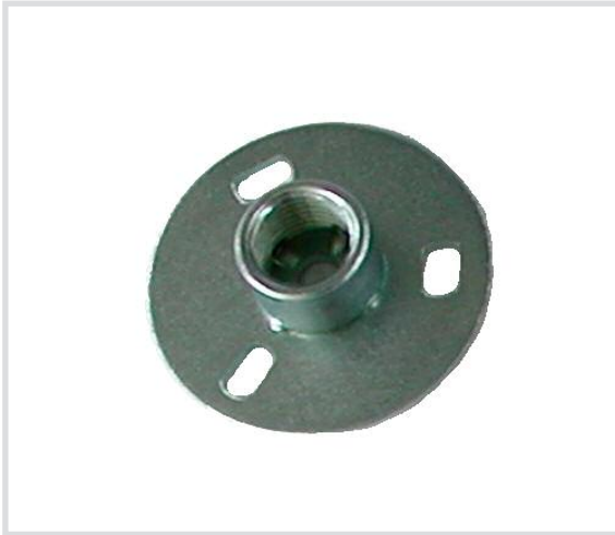
Art. 6245 Flangia portacollare tonda Round wall mount flange