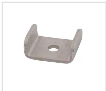
Art. 9016R Rondella a C per profilo CorSTRUT - AISI 316 CorSTRUT C washer - AISI 316