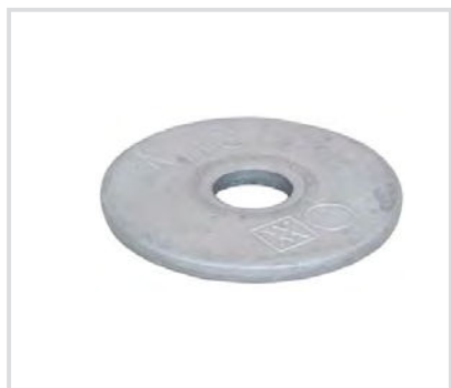
Art. 901R CorSTRUT rondella piatta - AISI 316 CorSTRUT flat washer - AISI 316