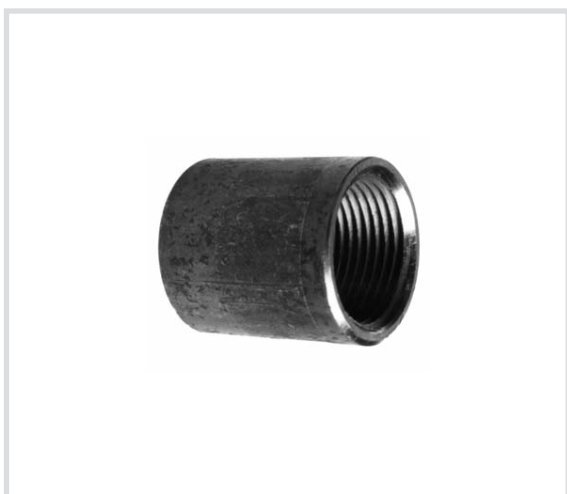
Art. 274 Manicotti pesanti Heavy socket Manchons lourdes