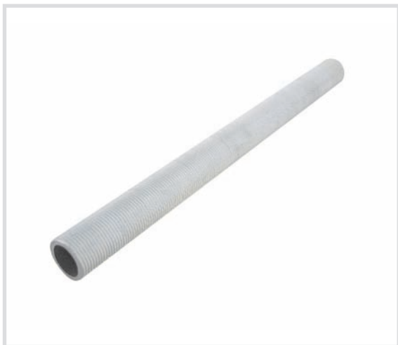
Art. 500fz Tubo filettato Threaded tubes