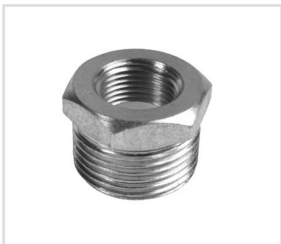
Art. 241 Riduzione con vite M.F. Reducing bushing Réduction avec filetage M.F.