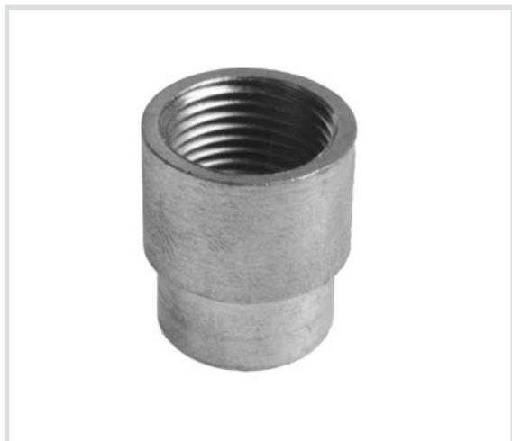
Art. 240 Manicotto ridotto F.F. Reducing socket Manchon réduit F.F.