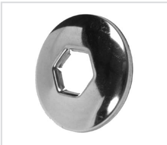
Art. 719 Rosetta in acciaio inox Stainless steel washer