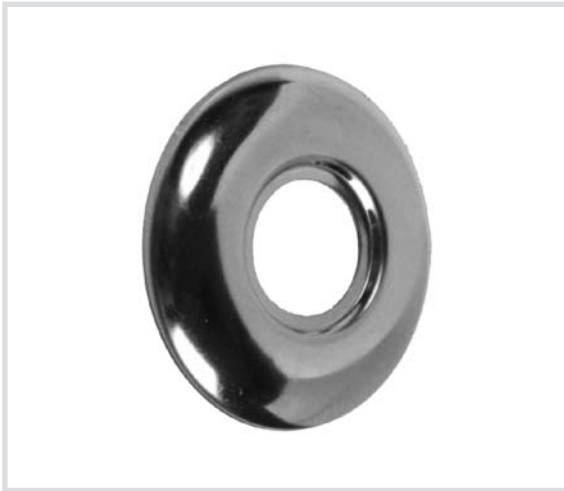
Art. 718 Rosetta in acciaio inox Stainless steel washer