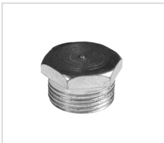
Art. 290 Tappo maschio esagonale Hex head plug Bouchon male hexagonal