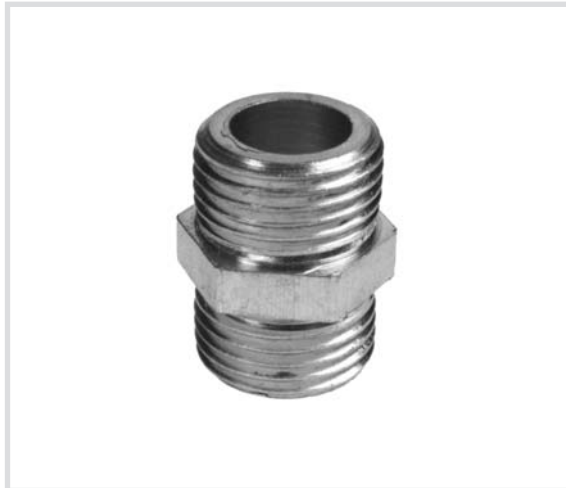
Art. 280 Vite doppia - sede piana Hex pipe nipple Pas de vis double