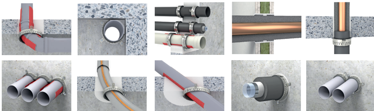
Tabella di applicazione e consumo per tubi