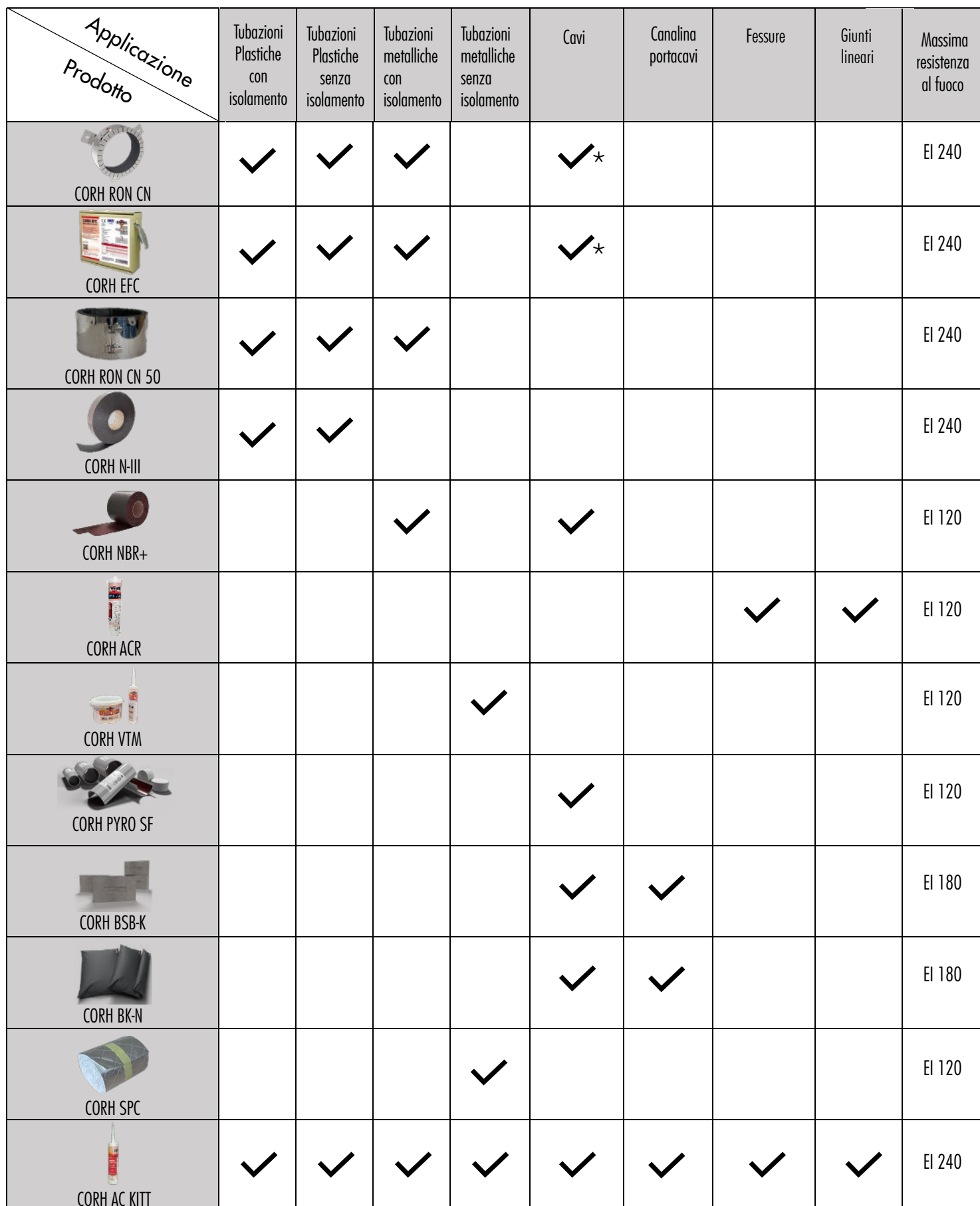
TABELLA DI SELEZIONE PRODOTTO