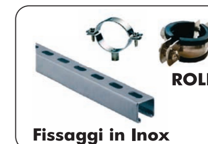
Fissaggi in Inox