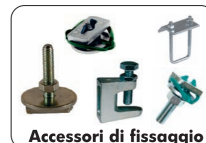
Accessori di fissaggio