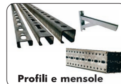
Profili e mensole