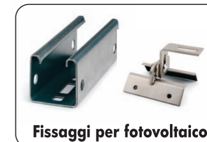
Fissaggi per fotovoltaico