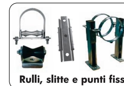
Rulli, slitte e punti fissi